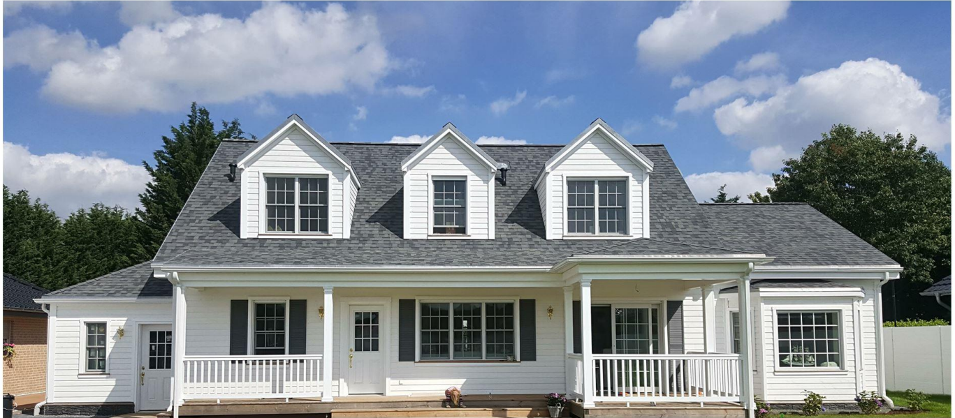
Von TWH errichtet in NRW