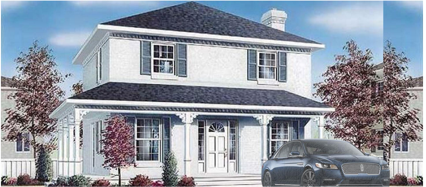
Unser kleinstes Stadthaus für die 2-Kind-Familie [zu errichten in BW]